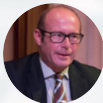
Ilmo. Sr. D. Ramón Gallo Magistrado Sala de lo Social Audiencia Nacional

12:30 Novedades en materia de subcontratación: Convenio de aplicación, RLT, centros especiales de empleo, régimen transitorio.