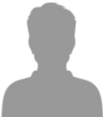
Ponente Pendiente De confirmar